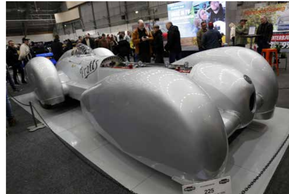
Glenn Billqvist har byggt ännu ett "monster". Den här gången en prototyp kallad Streamliner C16 med delar från 1939, bl a en rak 16 cylindersmotor från Buick på 8.2 liter!