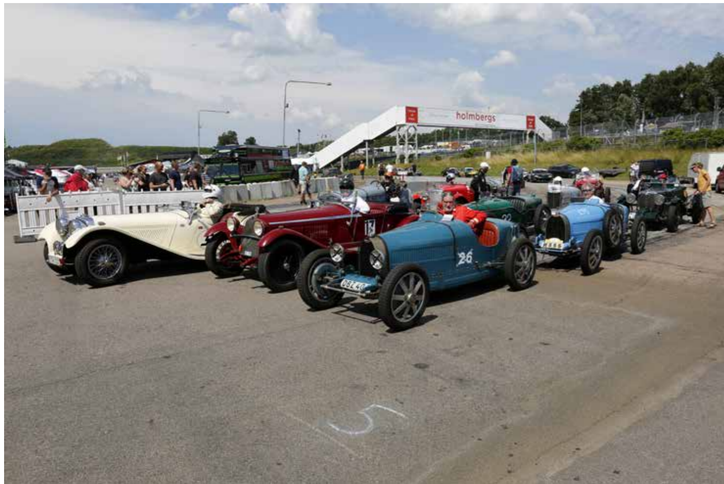
Förhoppningsvis får vi se ännu fler gamla fina klenoder från tiden före andra världskriget.

magnus.neergaard@telia.com 0706-37 04 90