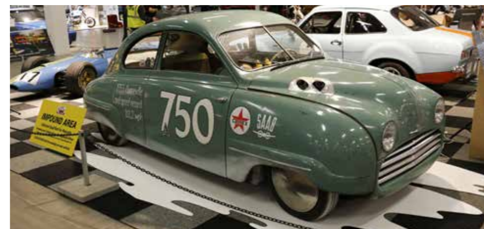
En SAAB 92 byggd för att slå hastighetsrekord på sandslätterna i USA. 120 km/h i toppfart. Bakom ser vi bilen som Ronnie Peterson debuterade med på Dalsland Ring 1966 i F3, en Swebe.