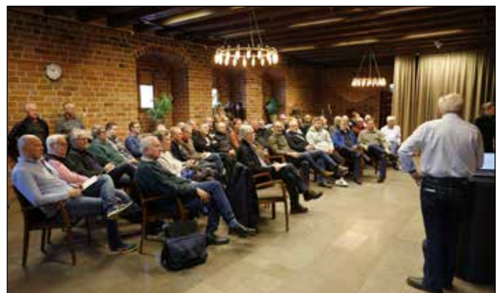
Helgen avrundades med information om kommande säsong.