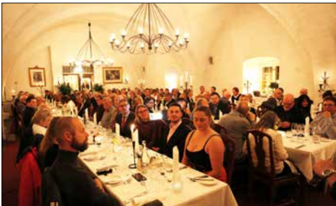
110 gäster fick plats i festsalen.