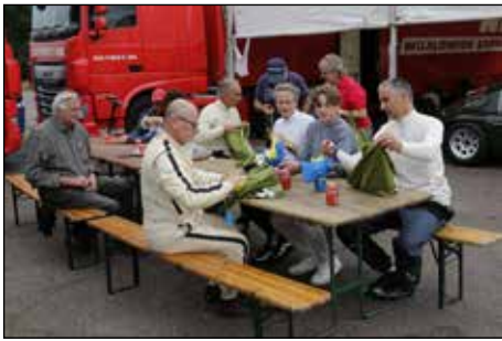
De holländska förararna fick en liten present från RHK, en svensk "goodie bag" med typiska svenska saker, som t ex knäckbröd, kaviar och snaps.