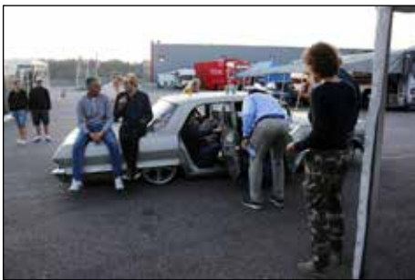
De lokala klubbmedlemmarna visade holländarna lite svensk raggarkultur. De fick lite cruising i depån med Eddie Meduza i högtalarna.