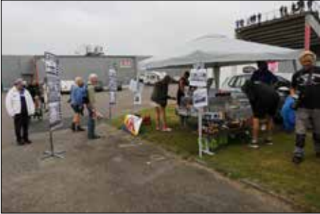
Marknadsavdelningen var uppskattad och välbesökt.