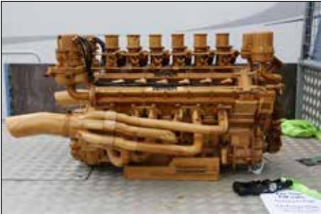
Detta otroligt vackra konstverk fanns att beskåda i depån.

Racerhistoriska Klubben anordnade årets fjärde deltävling tillsam-