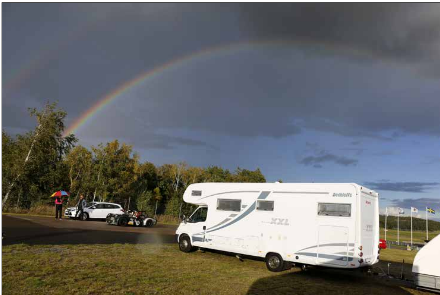
Regnbågen tittade fram mellan skurarna under Falkenberg Classic.