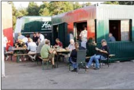
Holländarna var välutrustade, de hade till och med sig en egen bar!