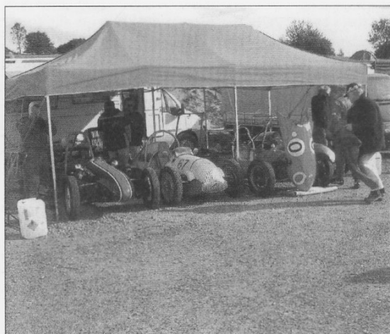
Svenskläget i depån.