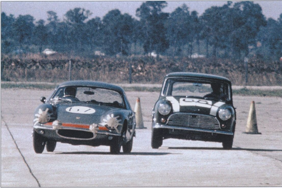
Även några standardvagnar var med. Här har vi en BMC Cooper S som jagar en Lotus Elite.