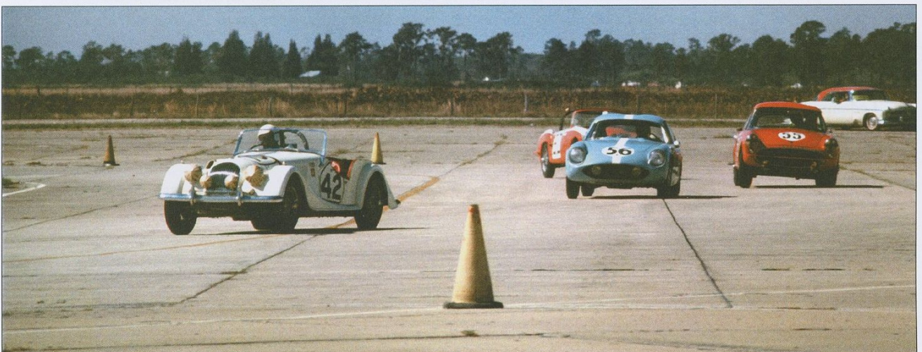
Blandad kompot! En Morgan +4 före en OSCA 1600 och en Sunbeam Alpine.