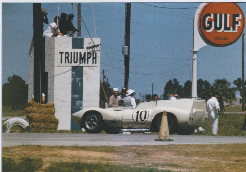
En Chaparall som tvingats ge upp.