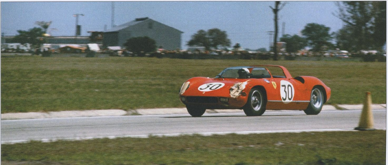
Här har vi vinnarekipaget av Sebring 12-timmars 1963: En Ferrari 250 P körd av John Surtees och Lodovico Scarfiotto.