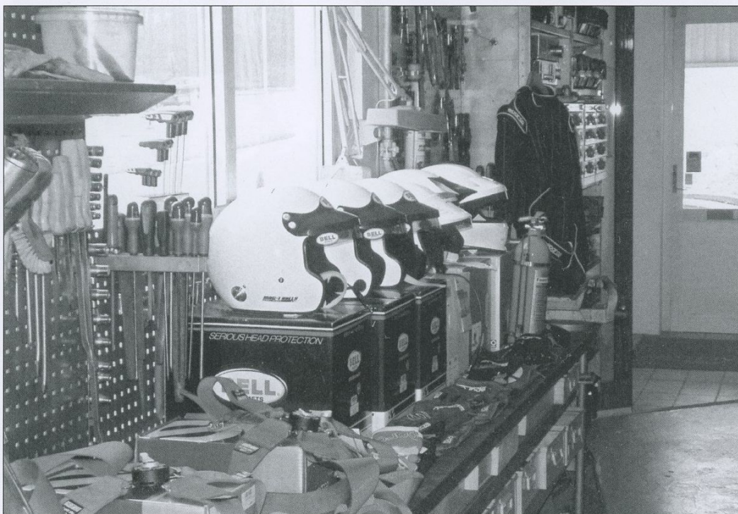
Ett imponerande program av utrustning för personligt skydd inom racing, visades av G-Partners från Karlstad, på säkerhetskonferensen i Virserum, se nästa sida.

Slutligen så noterar man med glädje att Lotus åter finns på prispallen i F1. Det var så länge sen sist att man glömt var och när det skedde senast.