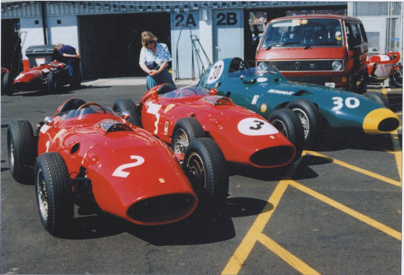
Formel 1 på Silverstone. Två Ferrari Dino och en Vanwall.

Du har väl inte glömt att betala medlemsavgiften? OM JA! Bra, då finns medlemsbeviset innuti tidningen. OM Nej! Då får Du bifogat en påminnelse.