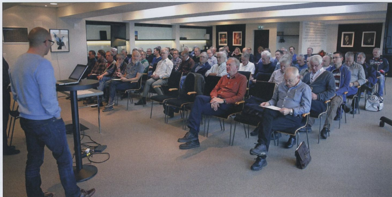
På söndagsförmiddagen var det planeringsmöte inför 2016 års säsong.