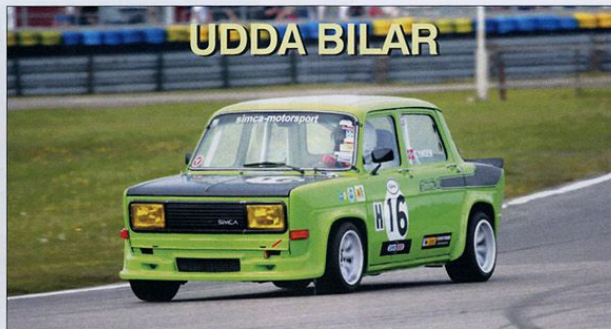
Simca Rallye 2 är en sällsynt gäst på racerbanorna. Den här kördes på Velodromloppet -15 av Geir Hagen från Norge.