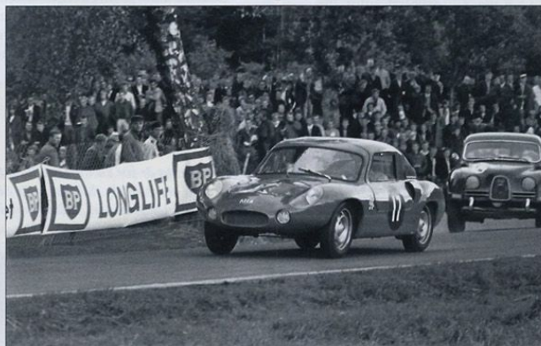
Atla-Renault är en synnerligen sällsynt GT-bil. Denna bil körs här av Leif Englund under Västkustloppet 1964. Tidigare körd av Arne Berg.