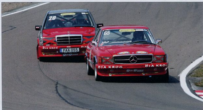
Mercedes-Benz är ovanliga i Historisk Racing. I familjen Schön finns det dock två stycken. Först en 350 SLC körd av Ola Schön som normalt körs av pappa Nisse. Han kör istället här den jagande 190 E 2,3 16V. SSM 2015.