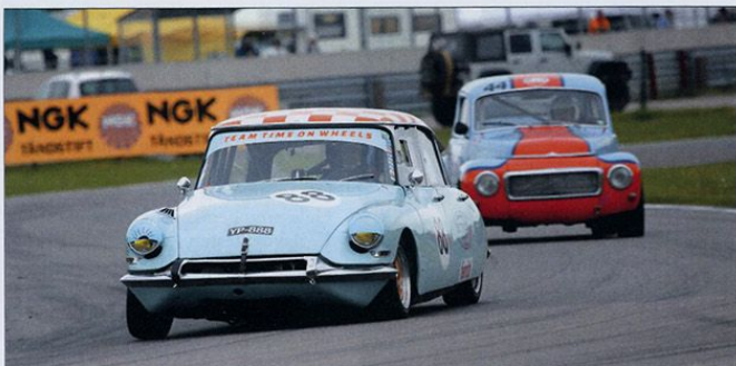
Sällsynt på alla racingbanor: Citroën DS 21. Kördes vid Velodromloppet -15 av Kaj Dahlbacka, som förstås också säljer Citroën i det "civila". Bengt Qvist i Volvo PV:n får skåda Citrån bakifrån.