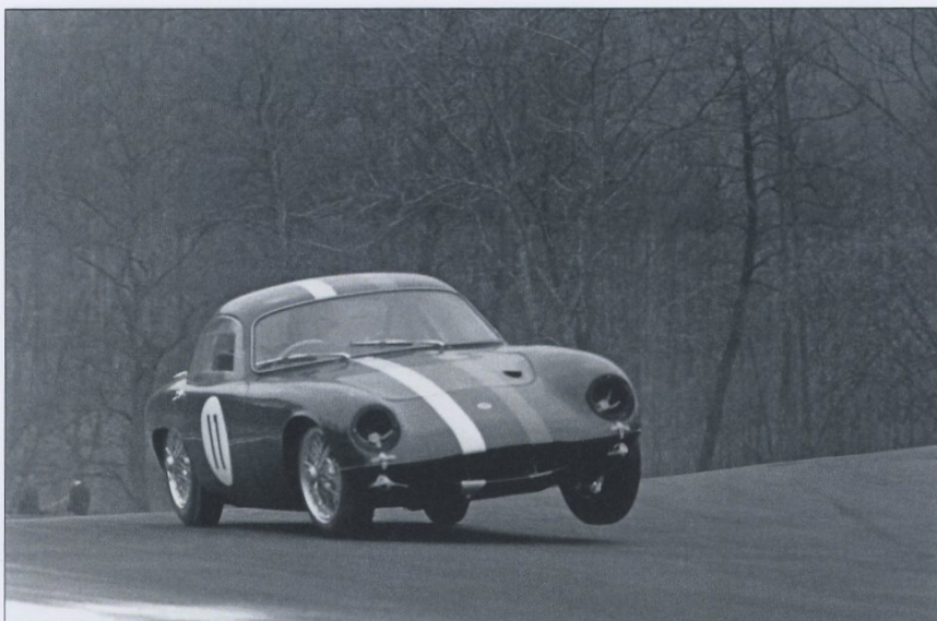
Staffan Wahlström 3-hjular sin Lotus Elite i klassen för Gr. 4 0-1150 cc. Det blev en för honom blygsam 4:e plats.