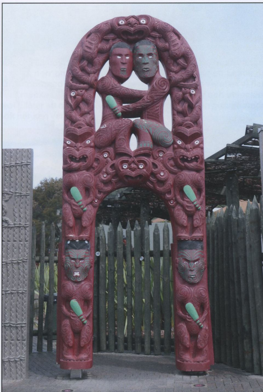
Skulptur i Whakarewarewa termiska park intill staden Rotorua.

På eftermiddagen var vi framme vid en camping intill havet i bukten "Bay of Islands". Där stannade vi 2 nätter. På onsdagen tog vi en båtut i bukten för att ev. simma ihop med delfiner. Vi var ute med båten i flera timmar och fann en flock delfiner ute på öppna havet. Men