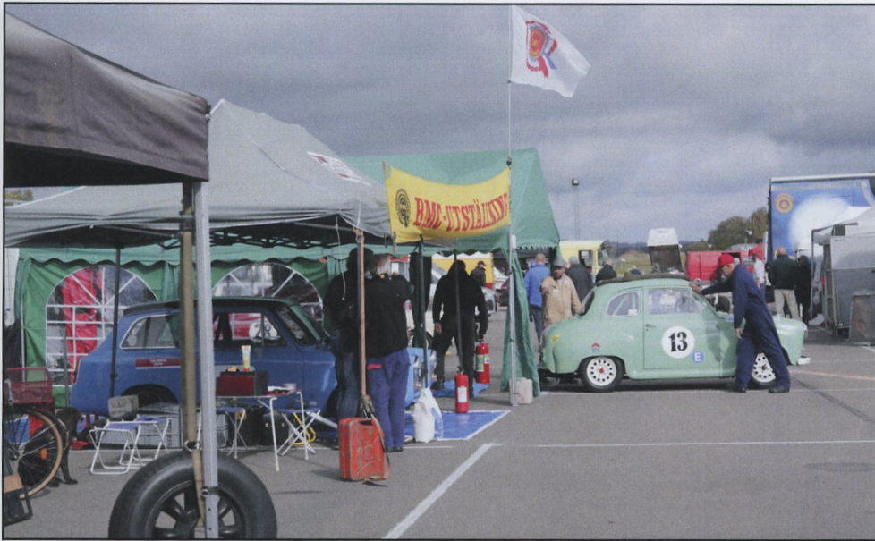
Aktivitet i (den äldre) Austindepån.