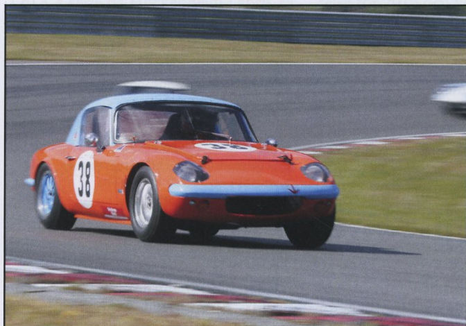
Sportvagnar: Tommy Bencsik, Lotus Elan