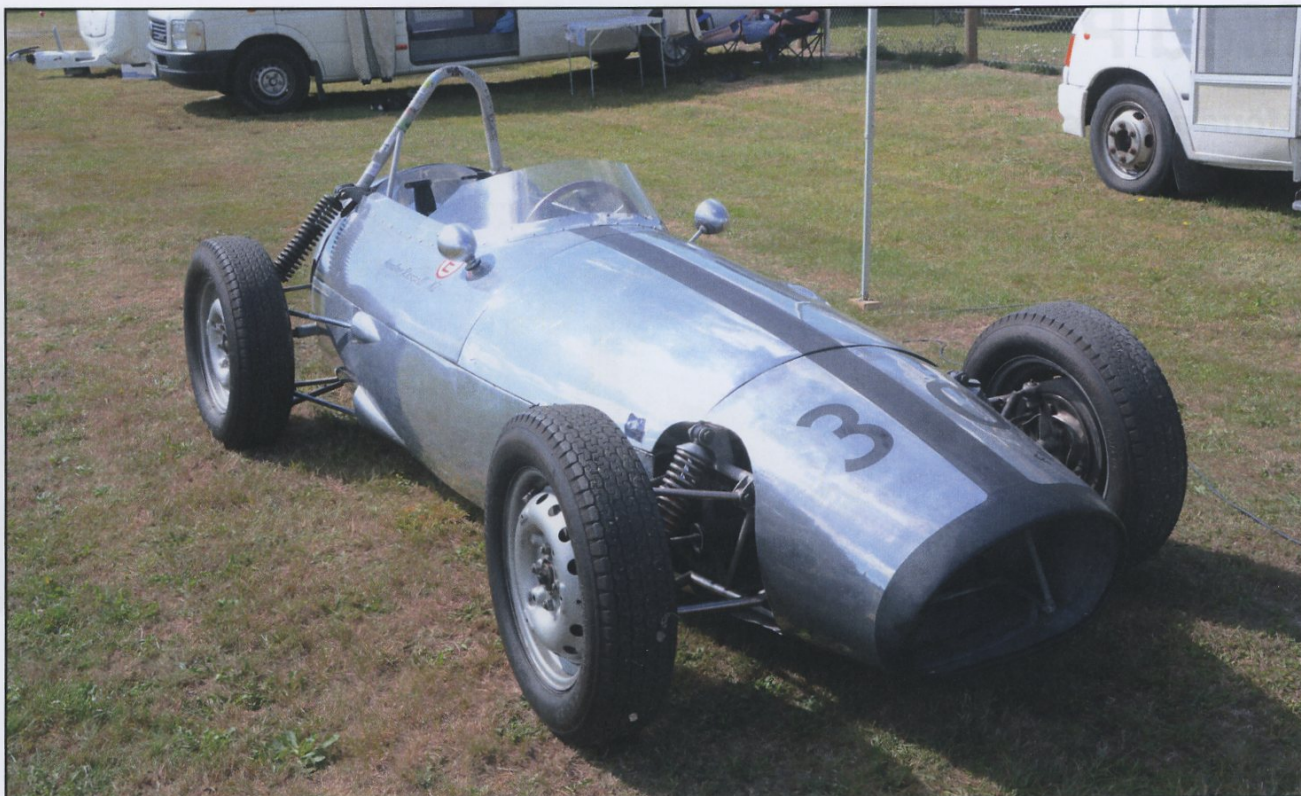
Depåbild från Bruce McLaren Motorsport. En FMZ Formel J från 1960