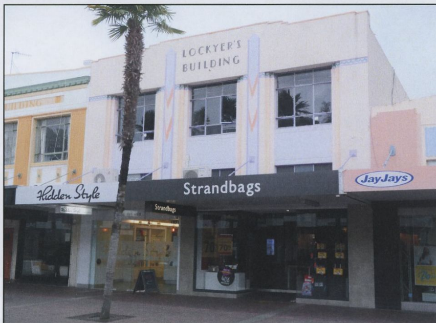
Art deco stadsdelen i staden Napier vid Hawke Bay på ostkusten

Fredag den 18/1 hade vi möjlighet till 6 testpass om 20 min. vardera. På andra