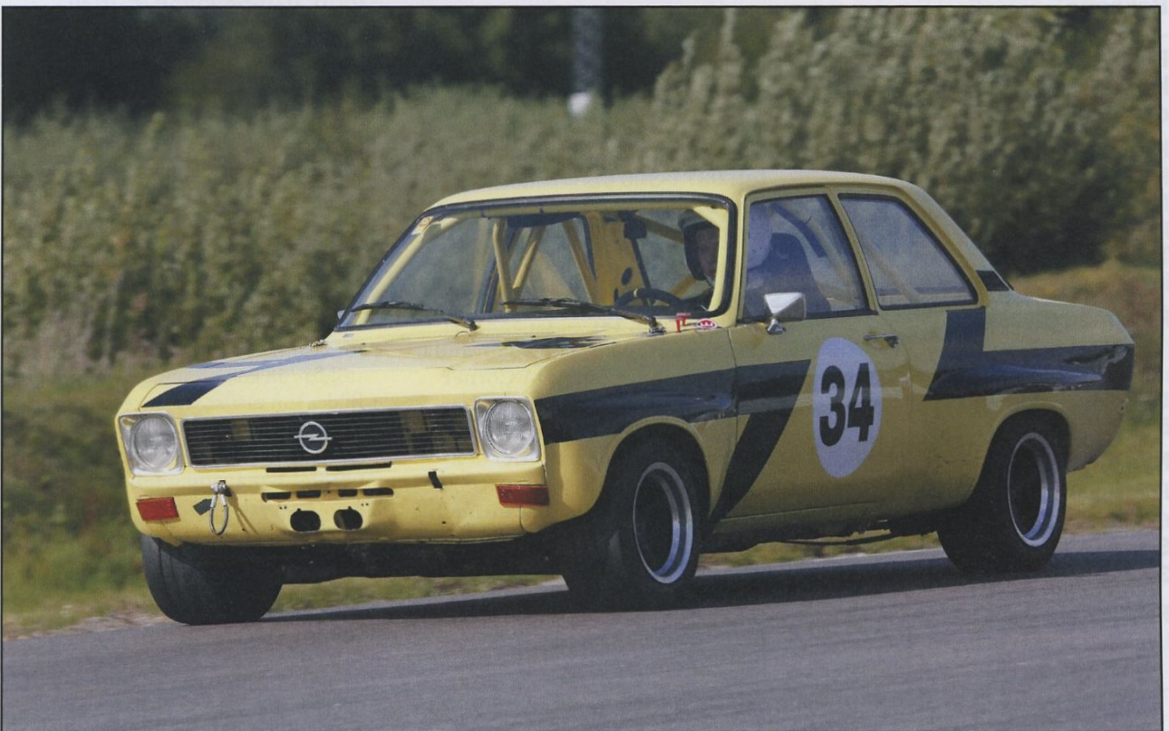
Arvid Viktorsson tog flest poäng i RHK Cupen och blev totalsegrare med sin Opel Ascona C/F.