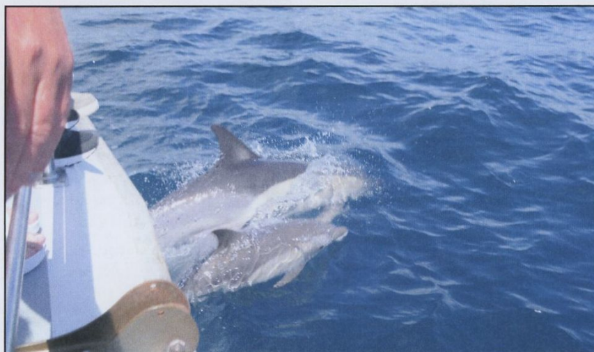
Delfinsafari utanför Russel vid Bay of Island på ostkusten.