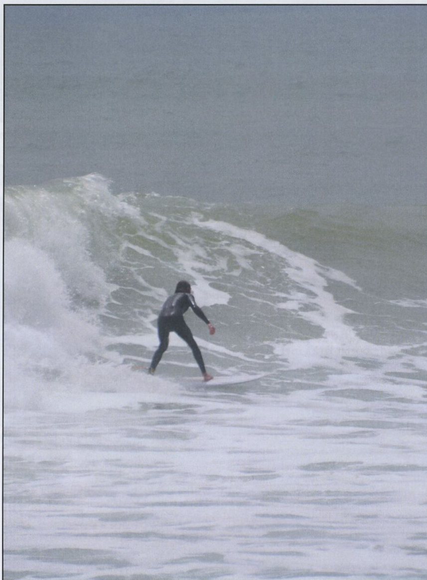
Raglan surfparadis på västkusten.

Torsdag 24/1 lämnade vi Raglan för att åka till Hamton Downs igen för att tävla på den korta slingan som är 2700 m. Vi anlände vid lunchtid. Containern var placerad ganska långt ifrån depån. Vi körde upp bilarna därifrån till vårt tält där vi skulle vara under helgen. Det var ganska rörigt om var vi skulle vara, hur stor plats osv. i tältraden. Boxarna var upptagna av andra bilar. Denna helgen var en tämligen stor tävlingshelg. Det var bl.a en deltävling i Formel Toyota, en serie för unga förare som vill upp. Formel 5000 var med här också.