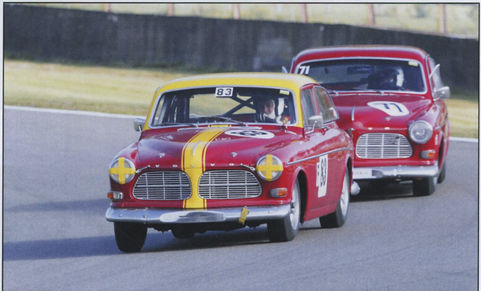
Amazoner! Per Olav Kilen följd av Anders Hylén.