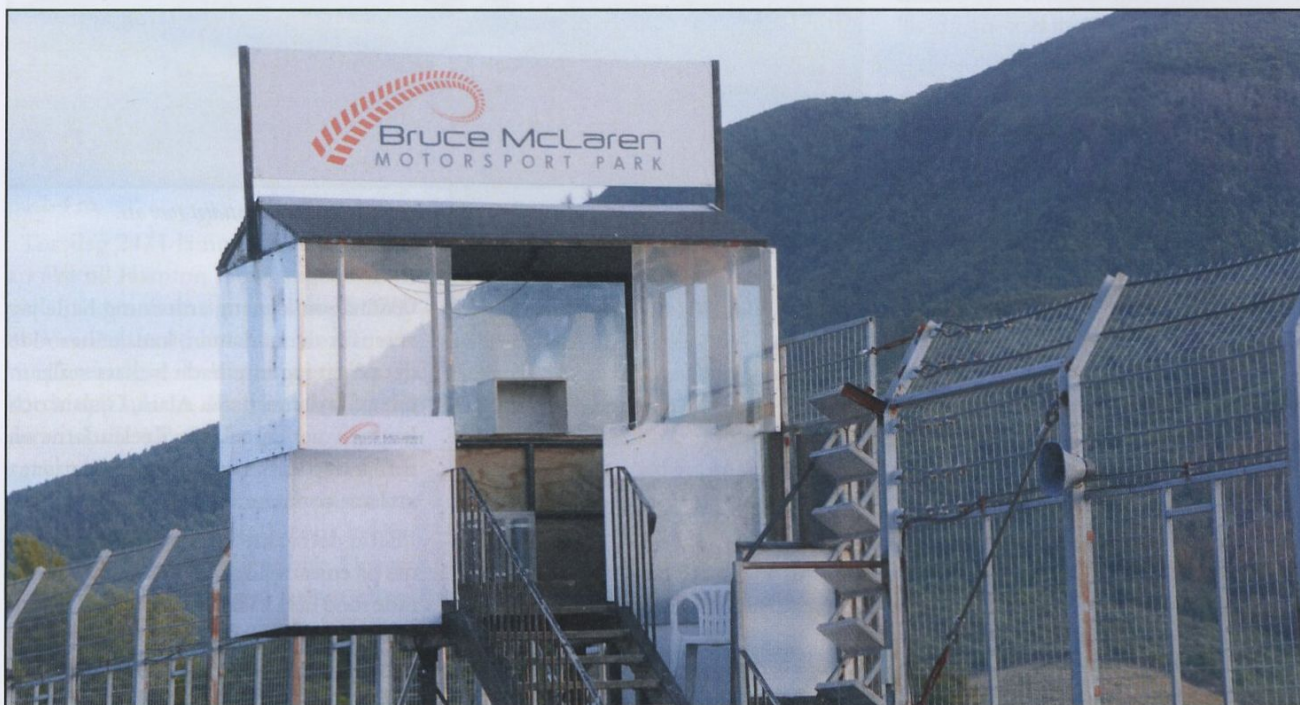
Posteringskur på Taupo racerbanan, kallad Bruce McLaren Motorsport Park intill staden Taupo i mitten av nordön

På förarmötet kom chefen för banan med en information till oss utländska förare, hur vi skulle bete oss vid en ev. jordbävning. Ganska udda information på ett förarmöte.