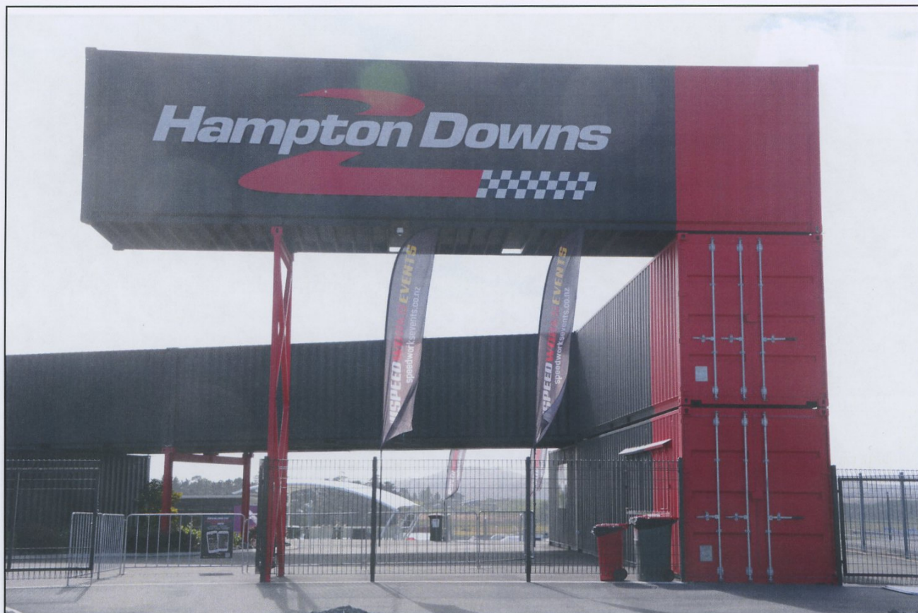
Bild 234 DSC 5717 Hampton Downs publikentré av gamla containrar.

Fredag den 25:e januari inleddes med test kl 10.00. Detta passet körde jag in mina nyköpta däck. Gick bra att köra den korta slingan på 1700 m. På eftermiddagen körde jag med mina slitna däck. Vi var 16 bilar som testade.