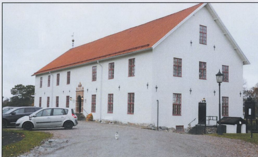
Sundbyholms Slott där festligheterna ägde rum.

Hillebrink presenterade RM-reglerna, där enda väsentliga ändringen är att minimumsträckan för att få