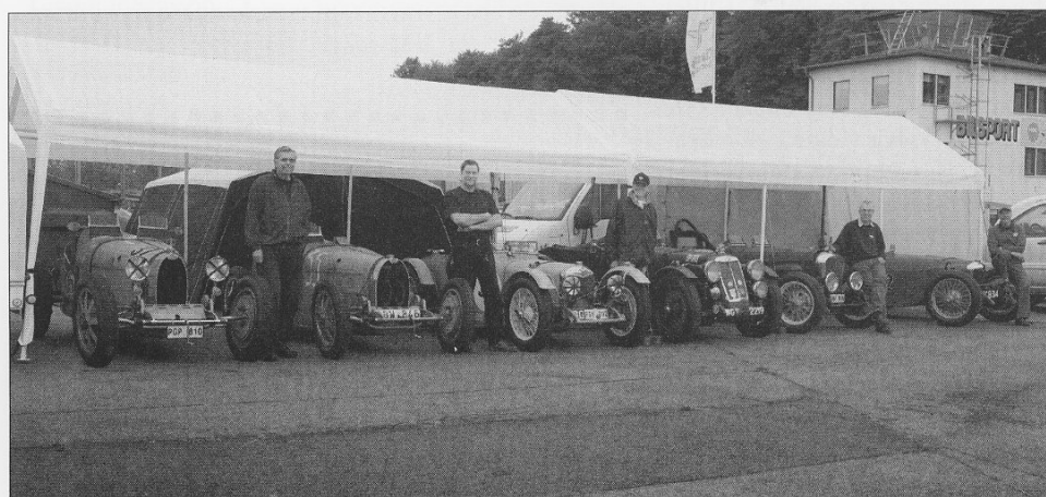
General- mönstring av förkrigsbilar i Knutstorps- depån vid Svenskt Sportvagns- meeting 2007.