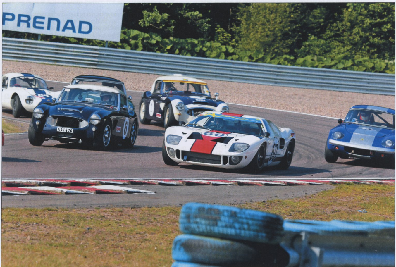
Trängsel i GT '65 på Knutstorp. Kennet Perssons Ford GT 40 ibland Lotus Elaner och Austin Healeys