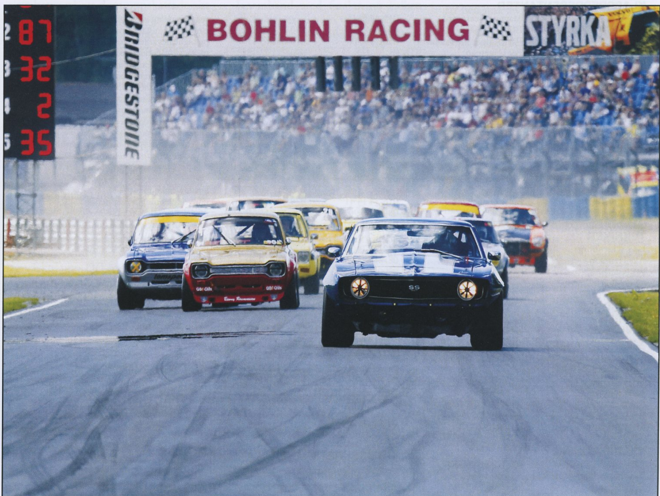
Fint väder, mycket folk på läktarna och Pekka Nyström i täten med sin Chevrolet Camaro.