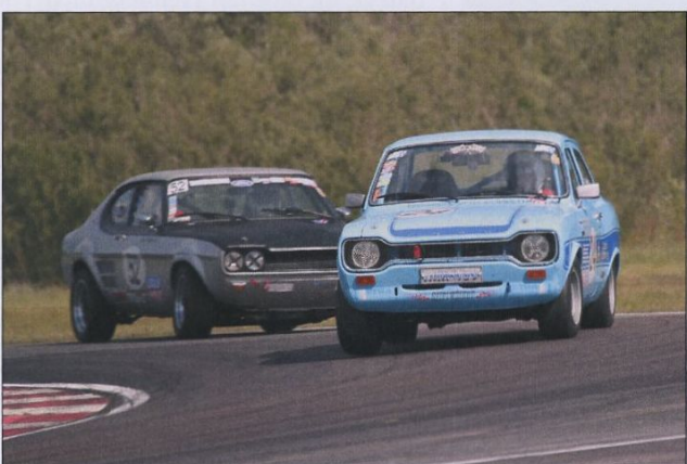
Vår finske gäst Sami Salo i en Ford Escort RS 2000 före Arne Björklund, Ford Capri 3000.