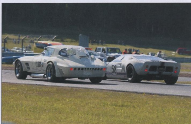
Batalj i prototypklassen; # 58 Jan Kling, Ford GT 40 och # 110 Kaj Dahlbacka, Chevrolet Corvette GS.