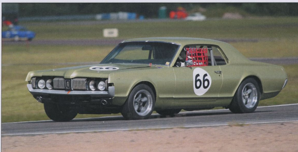
Mikael Östberg dök upp med en Mercury Cougar, men bilen verkade inte vara utsorterad och han fick bryta.