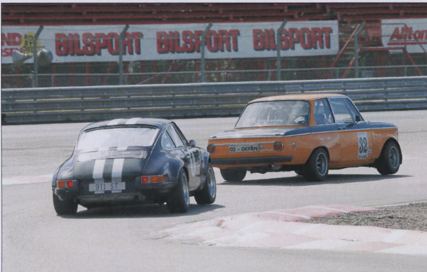
Staffan Borgström, Porsche 911 S/T jagar här Lennart Bengtsson, BMW 2002 ti under söndagsracet i Std. 66-71. Det gav också resultat då Staffan kunde gå förbi på sluttampen och vinna.