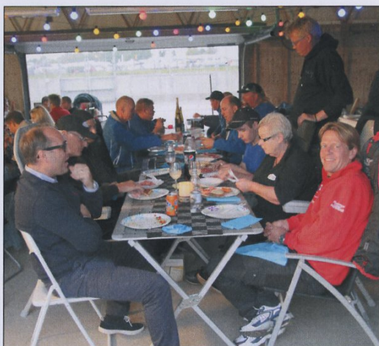
Kvällsvickning i Formel Fordgaraget.