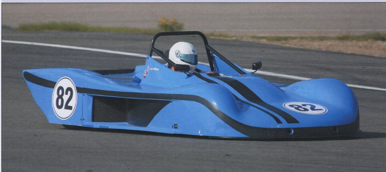
En av de mer märkliga bilarna i Historisk Racing måste vara Jan Hellbergs Shrike P 15, Sport 2000.