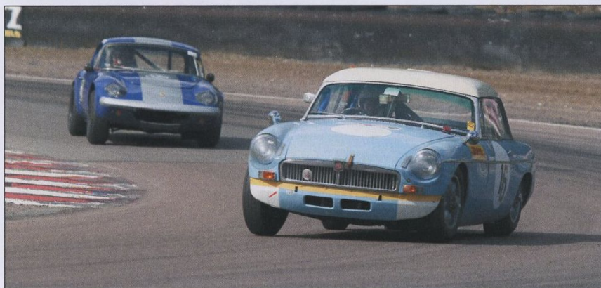
Björn Jansson rastade sin trogna MGB, här före Per-Åke Forsvall, Lotus Elan.