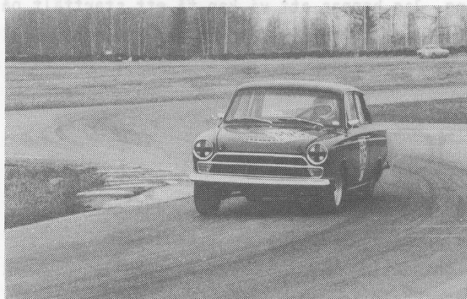
Grimborg, Cortina GT anno 1988.

Summan av kardemumman: Ett mycket lyckat inslag som kan rekommenderas alla som har möjlighet när nästa tillfälle gives. Håll ögonen öppna.