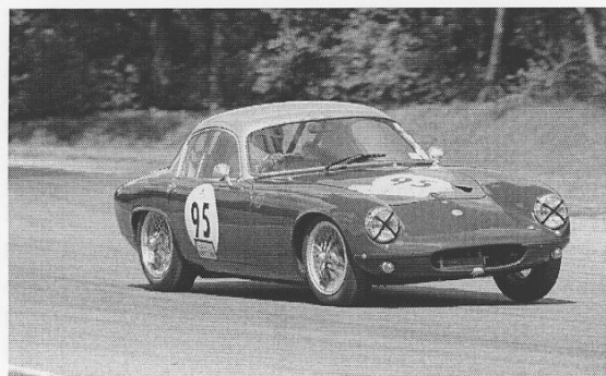
Jörgen Carlsson blev bäste poängplockare av alla GTS bilar med sin flinka Lotus Elite.